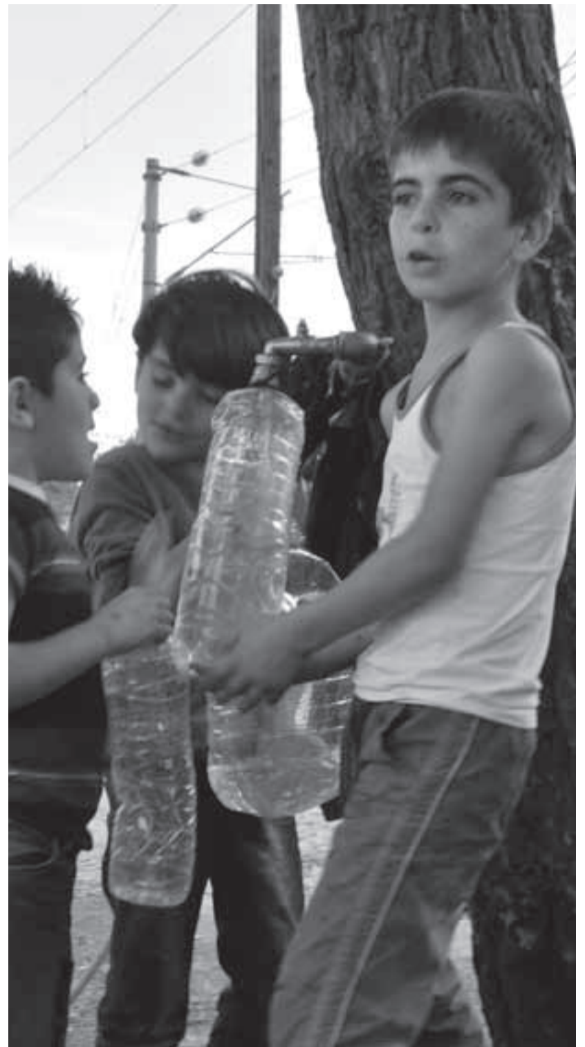
Παιδιά σε βρύση στην παραμεθόρια περιοχή της Ειδομένης.

Επιπλέον, με ειδική χρηματοδότηση από τη ΕΕ εγκαινιάστηκε ένα περιφερειακό γραφείο ασύλου στη Θεσσαλονίκη και άλλα πέντε σε ολόκληρη τη χώρα. Έτσι, μπορεί τουλάχιστον να βελτιωθεί κάπως η ανεπαρκής νέα υπηρεσία για το άσυλο, που πρωτολειτούργησε πριν δύο χρόνια. Προηγουμένως οι αιτήσεις χορήγησης ασύλου υποβάλλονταν στα αστυνομικά τμήματα.