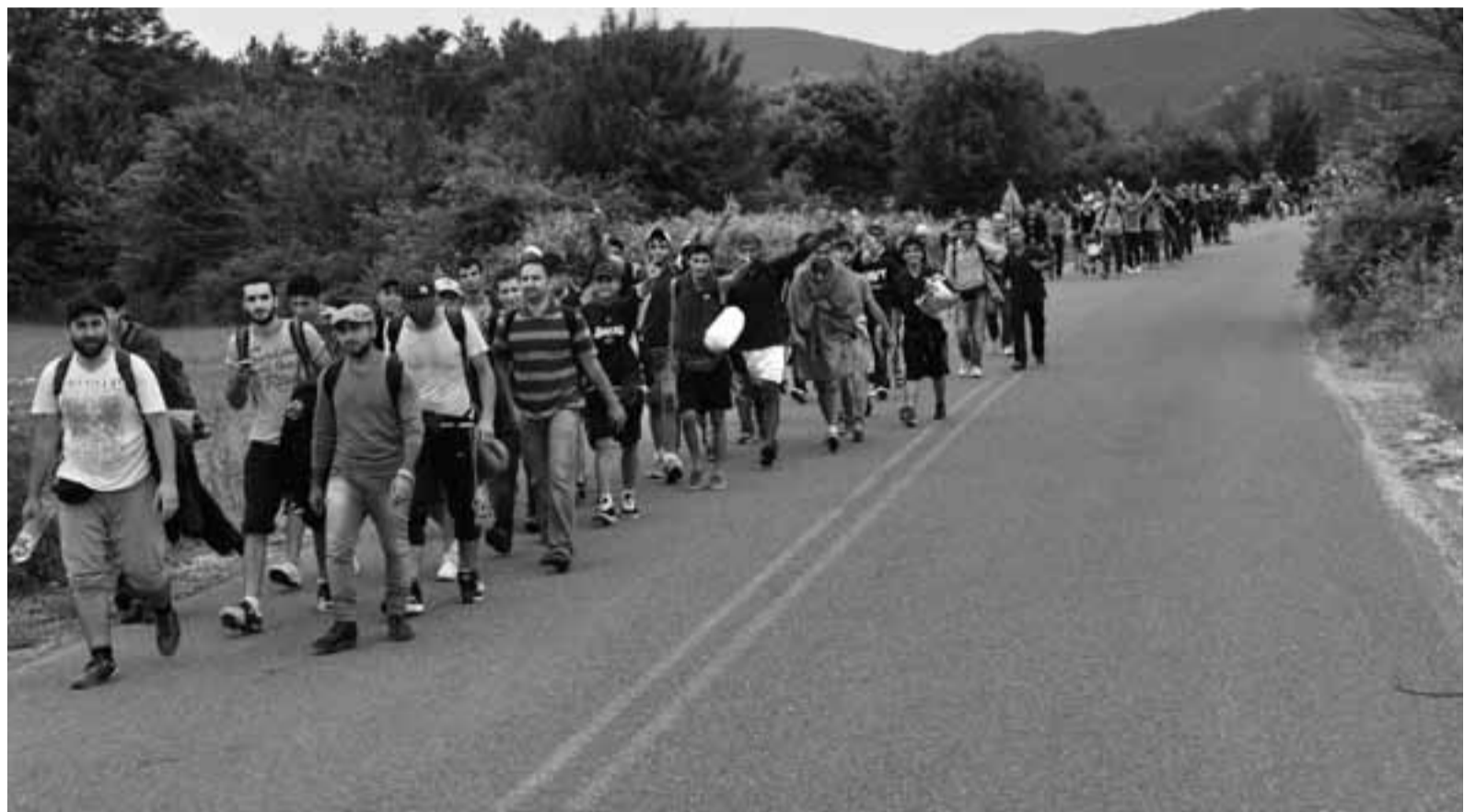
Πρόσφυγες στη Βόρεια Ελλάδα καθ' οδόν προς τα σύνορα Ελλάδας - Μακεδονίας.

ΣΥΡΙΖΑ, που αν και ταλαιπωρείται από τον οργανωμένο εκβιασμό της ΕΕ, έλαβε παρόλα αυτά αποτελεσματικά μέτρα για τη βελτίωση της κατάστασης των προσφύγων στη χώρα.