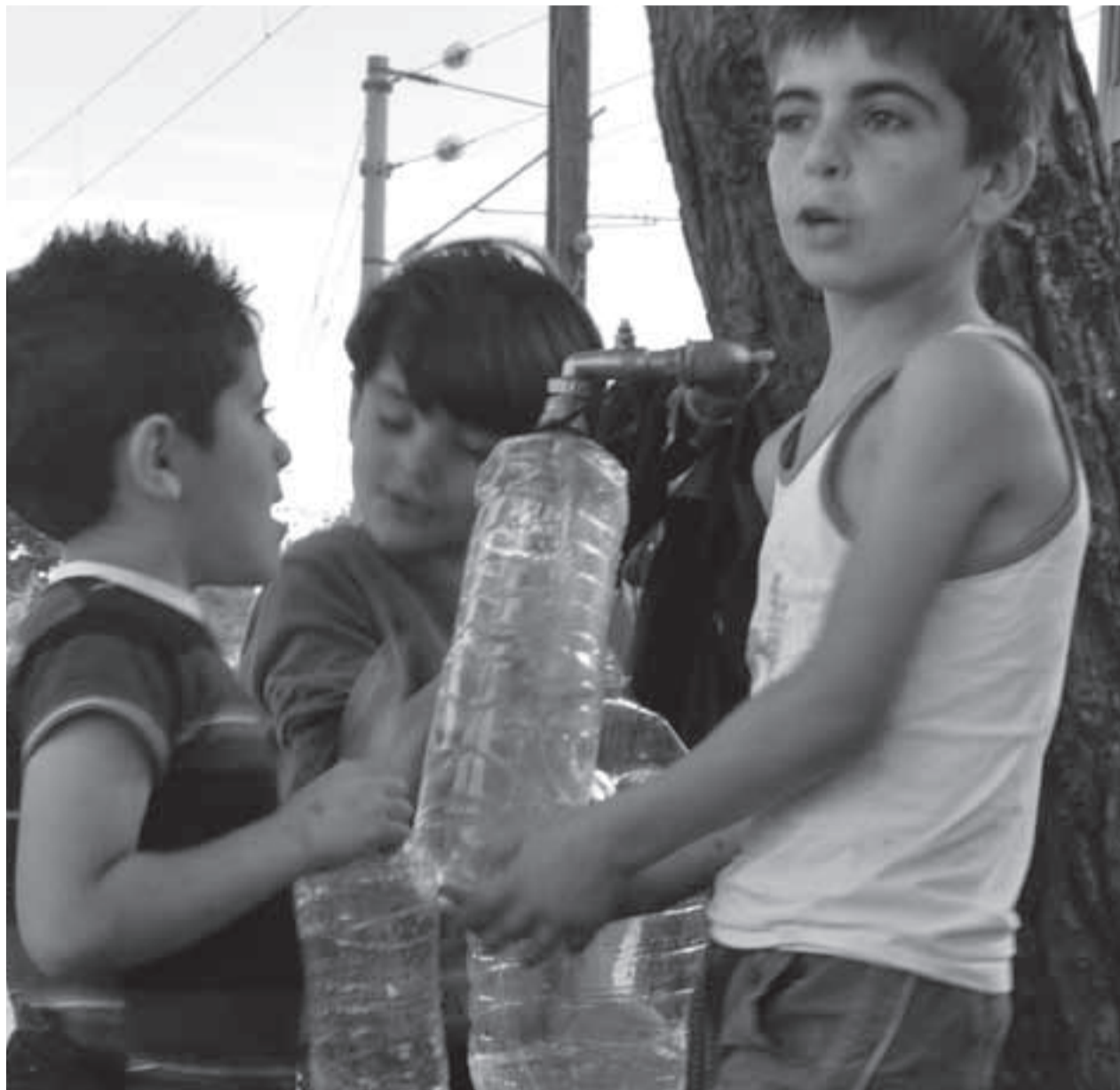
Niños junto a una tubería de agua en la franja fronteriza en Idomeni.