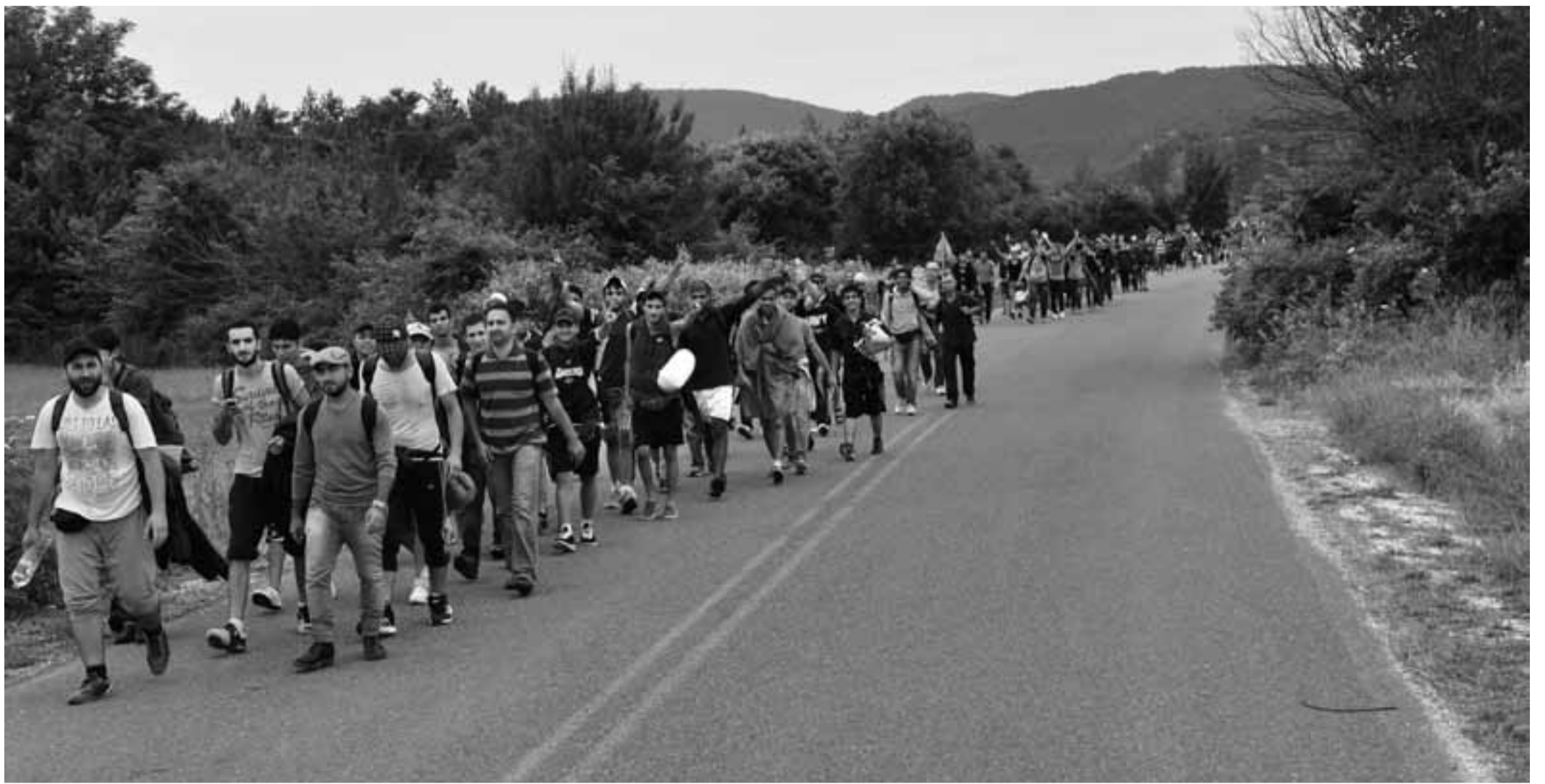
Refugiados en Grecia del Norte se dirigen a pie hacia la frontera greco-macedonia.