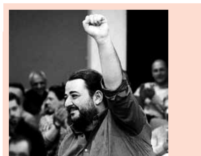
Atenas, 7 de julio de 2015.

¿Tienes alguna petición para el proyecto FactCheckHELLAS? Entiendo que en el marco del proyecto FCH han surgido muchas dudas y preguntas sobre los acontecimientos más recientes. Es natural que estos procesos provoquen diferentes interpretaciones políticas. Pero la solidaridad con el pueblo griego es ahora más importante que nunca. Quiero aclarar que todos los que apoyamos al gobierno de SYRIZA y que hicimos propaganda por un “No” en el referéndum no nos estamos haciendo ilusiones. Mi deseo es: por favor, sigan con el proyecto FactCheckHELLAS que ha sido tan exitoso hasta ahora. Confiamos en ustedes. Y les pedimos que ustedes confíen en nosotros y en el pueblo griego.